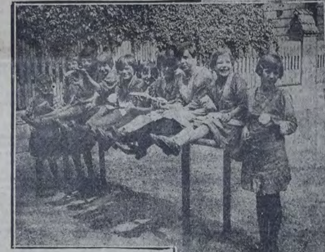
NIÑOS QUE APRENDEN JUGANDO

"El niño debe ser puesto en condición de ayudarse a sí mismo, y formado en la convicción de que debe servir con saber y conciencia a sus congéneres...". A este efecto, la ciudad de Berlín ofrece a la juventud confiada a su cuidado elementos de preparación por medio de exhibiciones etnográficas, cursos diversos, enseñanza de idiomas y de oficios, representaciones escénicas, etc.