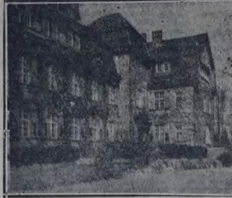
ESCUELA Y HOGAR DE NIÑOS

"El niño huérfano o abandonado debe ser recogido y atendido...". La ciudad de Berlín es madre en este sentido de 19.310 niños, y tutora de 54.538 pupilos. Los procedimientos de adopción dieron en 1928 padres adoptivos a 178 niños.