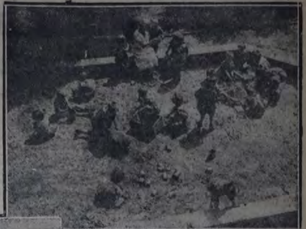
EN LA CASA DE HUÉRFANOS DE BERLIN

La llamada declaración de Ginebra, de agosto de 1925, tenía por objeto establecer la ayuda pública internacional a los niños y jóvenes, sobre las mismas bases. Y el servicio organizado en Berlín se inspira en los principios fundamentales de esa declaración: