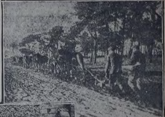
HOGAR DE ENSEÑANZA RURAL

"El niño enfermo debe ser atendido...". Y fueron cuidados en los establecimientos especiales 36.840 niños estropeados y jóvenes enfermos o anormales. En el año 1928 pudieron salir de esos establecimientos 2.092 jóvenes aptos para el trabajo.